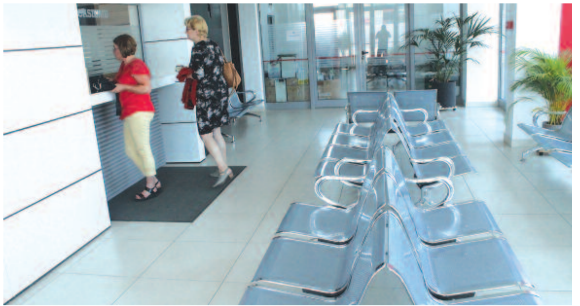
A Bálint Trans váróterme