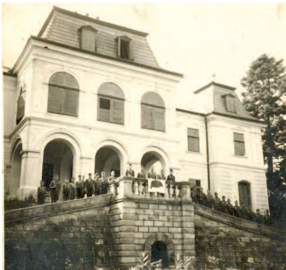
A lebontott kastély épülete