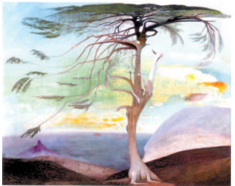
Csontváry Kosztka Tivadar: Magányos cédrus

395 éve, 1623. június 19-én született Blaise Pascal francia matematikus, fizikus, vallásfilozófus.