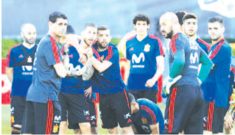
A csoportrangadó esélyeit nagyban befolyásolhatja, hogy a spanyolok két nappal az első mérkőzésük előtt szövetségi kapitányt váltottak: Julen Lopetegui helyére Fernando Hierro (b2) érkezett

Amíg a portugál és a spanyol keret döntő részében európai topklubokban is meghatározó szerepet betöltő labdarúgók találhatóak, addig a marokkói és az iráni válogatottat a hazai bajnokságból érkezők mellett leginkább közepes európai csapatokban játszó, de ott sem kiugró teljesítményt nyújtó játékosok alkotják. Ritka kivétel a Juventus marokkói védője, Mehdi Benatia, míg honfitársa, a 19 éves Acsraf Hakimi a Real Madrid játékosa, de eddig csupán epizód szerep jutott számára a Bajnokok Ligája címvédőjénél. Az irániak nemzetközileg legnevesebb képviselője a portugál szövetségi kapitány, Carlos Queiroz, akinek a vb-rajt előtti legnagyobb problémája az volt, hogy az amerikai gazdasági szankciók miatt a Nike nem biztosítja a cipőket a vele szerződésben lévő játékosainak.