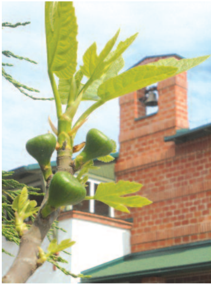
Fügevira és harang

A dombok a gyermekek hegyei, hol nehéz csillag-fürtök teremnek, s mint szüretkor, ha mustjuk foly, álmokkal töltik esténként a lelket.