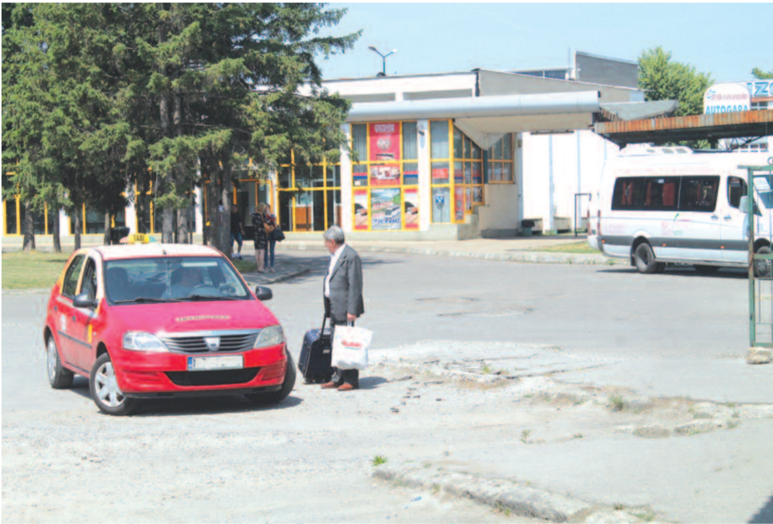
A Voiajor autóbusz-állomás parkolója