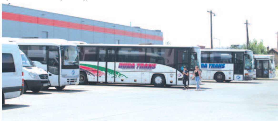
A Duda Trans peronjai

Mivel a szállítási törvény állítólag rendkívül megengedő, számtalan fuvarozó cég létesíthet busz-állomást. A tapasztalat azt mutatja, hogy az utasok érdekeit kéthárom elhivatott szállítócégen kívül senki sem veszi figyelembe. Pedig egy hatékonyan működő közös diszpécserszolgálattal, információs irodával, de legfőképp naprakészen aktualizált digitális tájékoztató táblákkal megoldhatnák az általunk jelzett hiányosságok egy részét. Remélhetőleg a jövő héten útjára indított ötletpályázatra beérkező tervek és a mobilitási terv kivitelezése során az ilyen jellegű hiányosságok is figyelembe veszik.